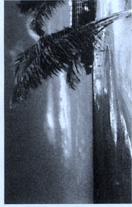
マウイ島屈指のリゾート地、カアナハナ