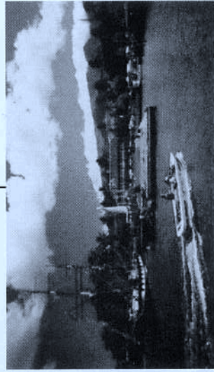
ノスタリジックな港町、ラハイナ