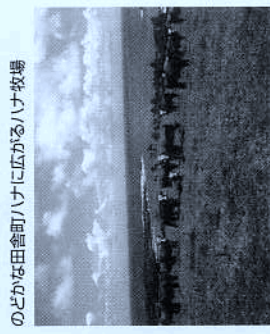
のどかな田舎町ハナに広がるハナ牧場