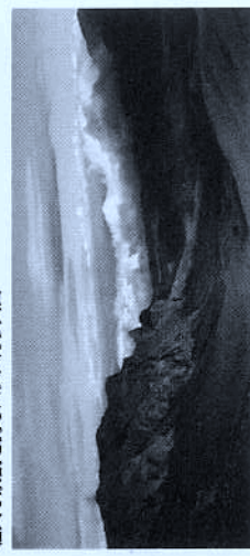
壮大な景観を誇るハレアカラ火口