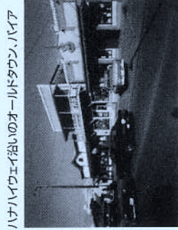
ハナハイウェイ沿いのオールドタウン、パイア