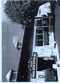
KONA COFFEE MILL

ようこそビッグ・アイランド、ハワイ島へ。 アロハ! このたびはダラーレンタカーをご利用いただき、ありがとうございます。このマップには、ハワイ島のおもな道路、観光スポットなど、ドライブに必要なインフォメーションが記載されています。くれぐれも安全運転をこころがけ、美しい南の島のドライブを満喫ください。 — マハロ