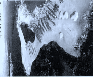
HOTEL KING KAMEHAMEHA (ホテル・キング・カメハメハ)